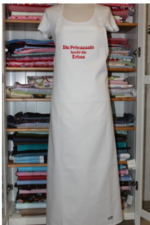
Schürze „Latzschürze“ Bestickt mit „Die Prinzessin kocht die Erbse“ Größe: 110 x 80 cm