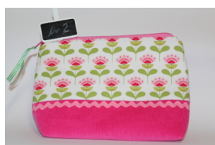
Täschchen „Pretty in pink 1 oder 2“ Aus Cord und Baumwolle mit Band Größe: Preis: 18,00€ incl. MwSt.