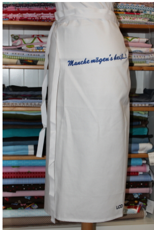
Schürze „Vorbinder“ Bestickt mit „Manche mögen´s heiß“ Größe: 80 x 100 cm