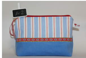
Täschchen „Frühling 1 oder 2“ Aus Cord & Baumwolle mit Yoyo o. Band Größe: Preis: 18,00€ incl. MwSt.